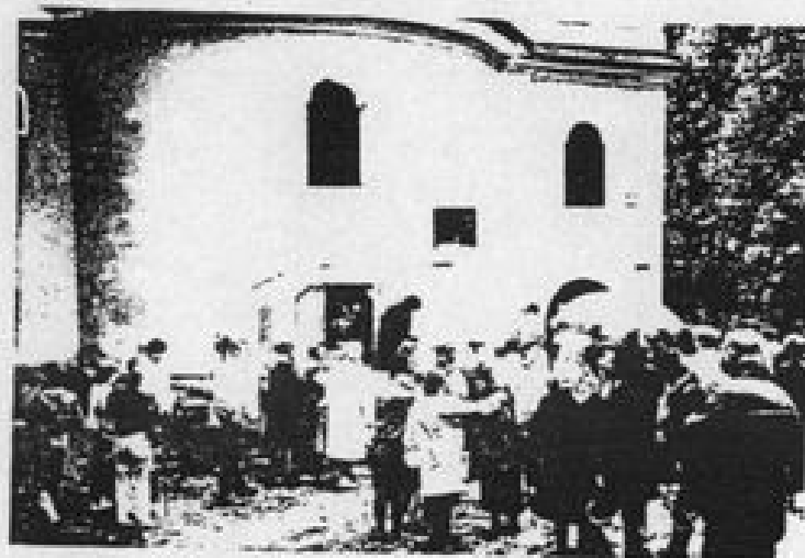
Sviatok sv. Jureja 1990